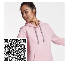
URBAN WOMAN SU1068